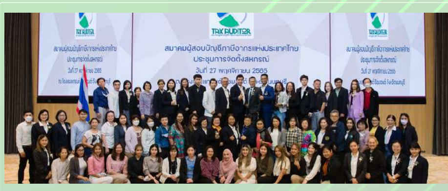
ถ่ายรูปร่วมกันเป็นที่ระลึก