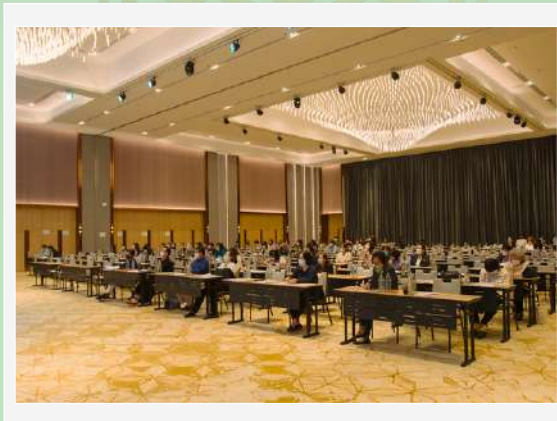
บรรยากาศการประชุมใหญ่